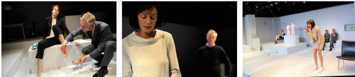
"Af mandens ribben" dramatisk projekt på Odense Teater (2012)

Dramaturgi 1 lægger vægt på nærlæsning af dramatiske værker mhp. at sikre en grundlæggende viden om og forståelse af den dramatiske genres mangfoldighed og kompleksitet. Kursets første del tager udgangspunkt i den klassiske dramaturgi med henblik på at understøtte den studerendes dramaturgiske viden og analytiske kompetencer. I kursets anden del læses værker af centrale dramatikere fra det 20. århundrede til i dag med særligt fokus på dialektikken mellem tradition og fornyelse.