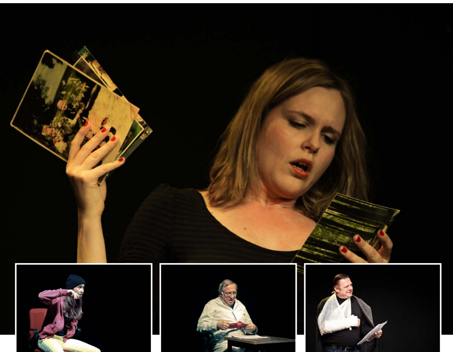
Monologfestival på Transformator (Aalborg Teater, 2010)