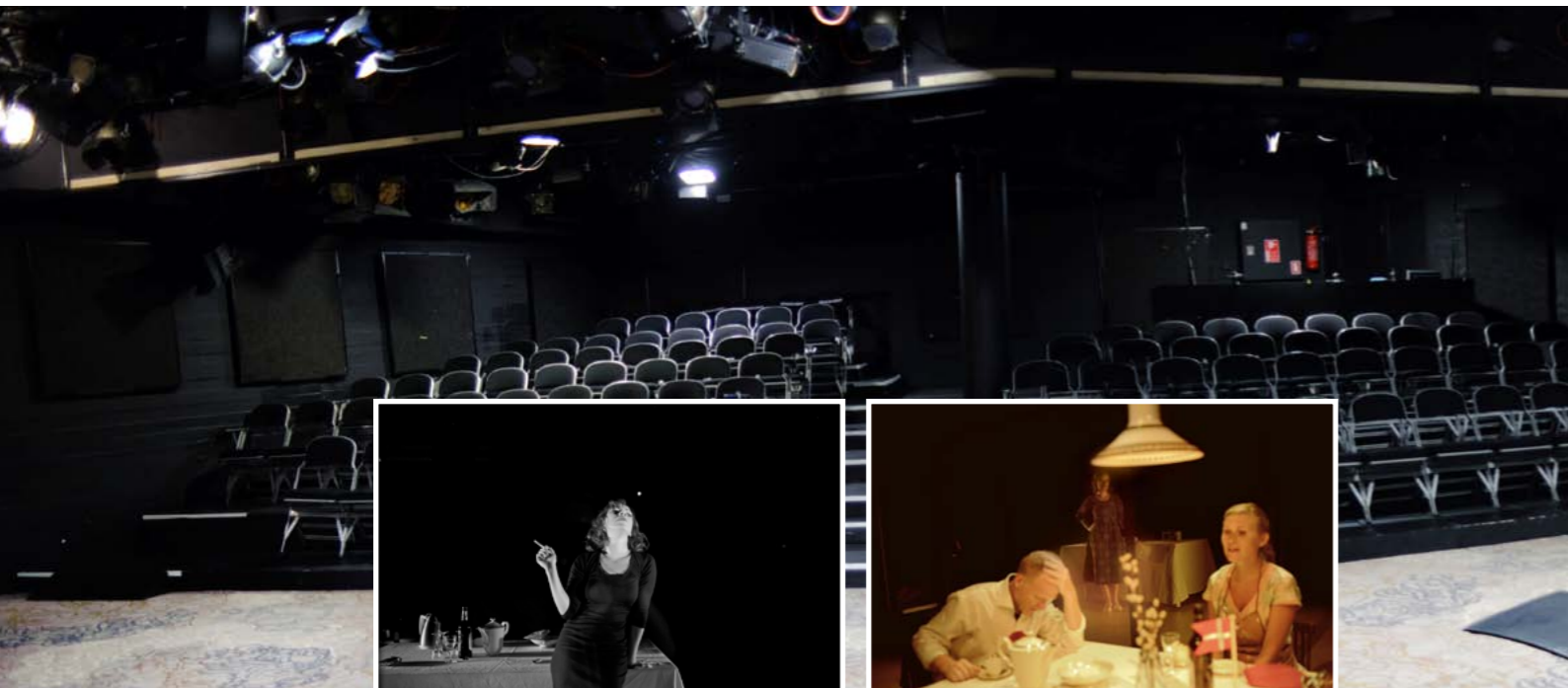
"Nekrologer" Dramatisk projekt på Aarhus Teater (foto: Rumle Skafte, 2012)