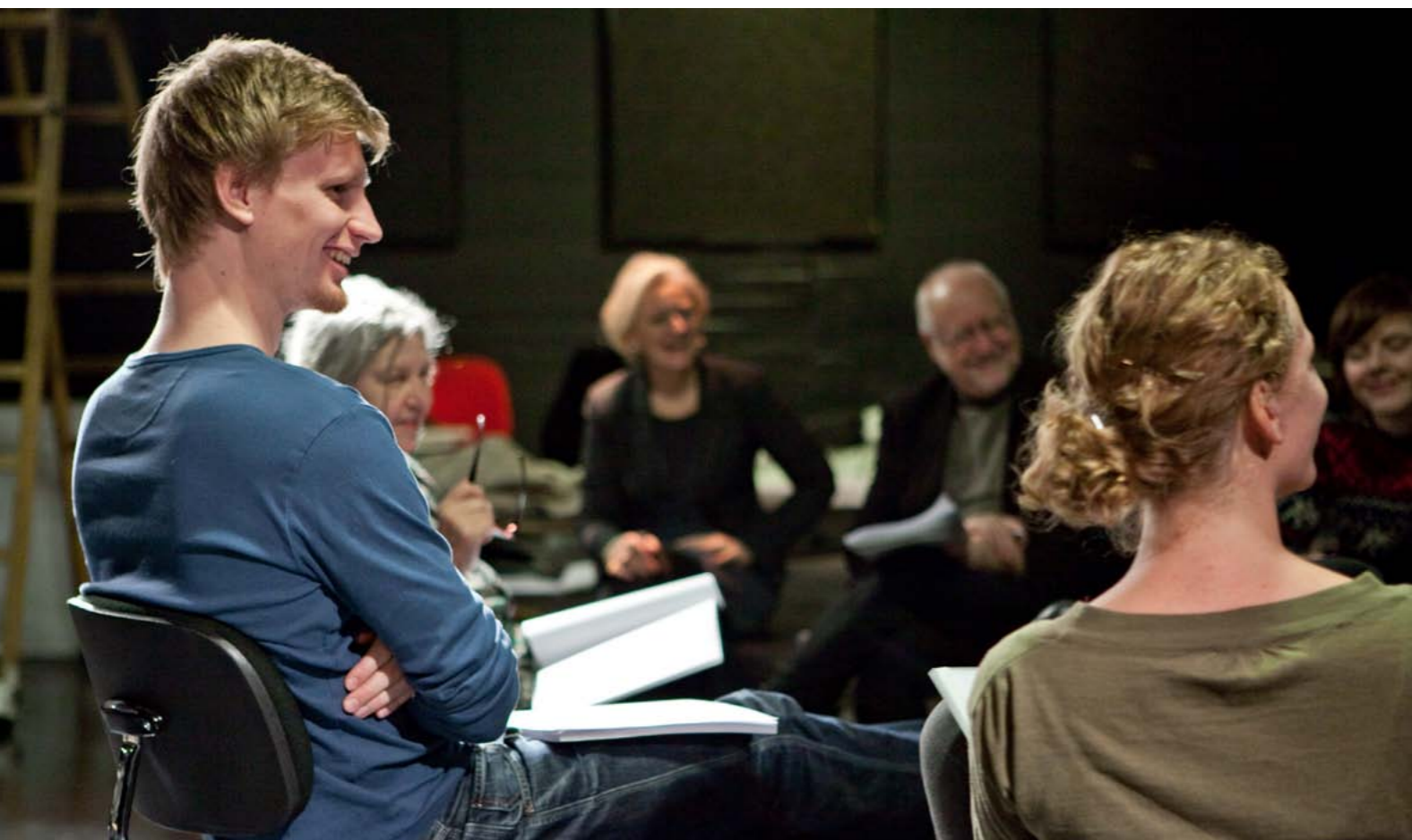
Tekstworkshop på Aarhus Teater